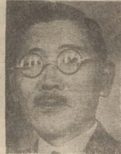
Eski Hariciye Nazırı Togo

İstifalar devam ediyor, Hariciye Nazırlığı muavinliğine şarki Asya servisleri direktörü getirildi