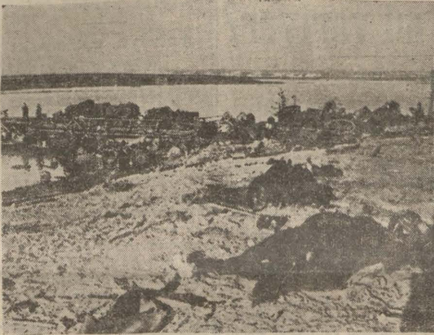
Don nehrini aşmak için Alman küt'alarına zemin hazırlamak üzere Stuka tayıyareleri tarafından sahildeki Rus müdafaasında yapılan tahribat

Almanlar Stalingrad cephesinde yeniden toprak kazancılar. merkezde Sovyetler birkaç mahal işgal ettiler