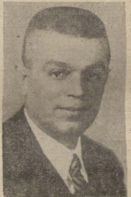
Ticaret Vekili Dr. Behçet Uz usulüne devam edilecektir. Bunlardan ileride istisna edilecek şehirler gene Vekâletçe alâkadarlara bildirilecektir.

Ankara, Amasya, Aydın, Bilecik, Bitlis, Burdur, Bursa, Çanakkale, Çankırı, Diyarbakır, Edirne, Elâzığ, Erzurum, Giresun, Gümüşhane, Hatay, İzmir, İçel, İstanbul, İsparta, Kastamonu, Kayseri, Kırıkkale, Kocaeli, Malatya, Manisa, Mardin, Maraş, Muğla, Ordu, Rize, Samsun, Seyhan, Siirt, Sinop, Sivas, Tokat, Trabzon, Urfa ve Zonguldak şehirlerinde yeni verilecek emirlere kadar karne